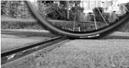
Velosicheres Gleis verhindert Unfälle

Straßenbahnschienen sind ein Problem für Radfahrer. Um die Sturzgefahr zu verringern, hat Dätwyler ein velosicheres Gleis entwickelt, bei dem das Verklemmen des Rades in der Schienenrinne unmöglich wird. Auch Fußgänger profitieren von diesem System, da ein Umknicken verhindert wird. Dies erreicht Dätwyler mit einem in die Schienenrinne geschraubten Sicherheitsprofil. Eine Spurführungsplatte schränkt die Sinusfahrt des Schienenrades ein, erhöht dadurch die Lebensdauer des Gummiprofiles. Die gesamte Konstruktion lässt sich jederzeit und ohne großen Arbeitsaufwand ausbauen, um z. B. Schienenarbeiten durchzuführen. Damit Schmutzpartikel die Rinne nicht verschließen, besitzt sie einen Entwässerungsablauf und lässt sich komplett ausspülen. Mit der neu entwickelten RAILRESTORE stellt Dätwyler eine weitere Neuheit vor. Damit lassen sich Schienenbrüche in kürzester Zeit auf höchstmöglichstem Niveau beseitigen.