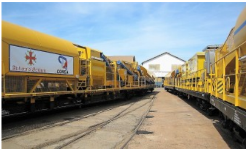
Gelber Zug: Betonproduktions-Zug für Crossrail, Kapazität ca. 250 m 3 /Tag