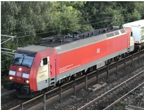
Lokomotiven, Güter- und Personenzüge