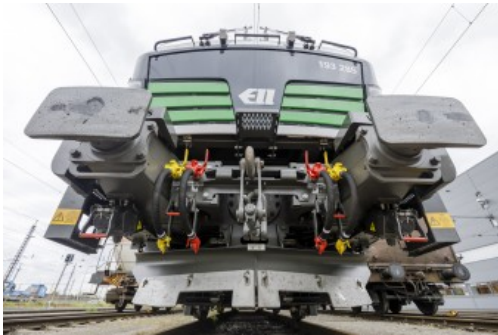
Europäisches Lokomotiv-Leasing „ELL Vectron“

Die europaweit agierende European Locomotive Leasing Group (ELL) mit Hauptsitz in Wien beschäftigt derzeit 40 Mitarbeiter und ist spezialisiert auf das Verleasen von modernsten AC- und Multisystem-Lokomotiven entlang der europäischen Haupttransportkorridore mit höchster Verfügbarkeit. Der „ELL Vectron“ überzeugt mit einem eigenen umfangreichen Ersatzteillager, der ELL Academy für Energiespar- und Expertentrainings, ELL Lokführern und dem optimierten Maintenance Programm. Instandhaltung 4.0 wird bei ELL Group großgeschrieben und mit jedem weiteren Monat liefert die ELL Flotte neue Erkenntnisse in Bezug auf Predictive Maintenance. Erste Resultate fließen derzeit in das optimierte Wartungs-Manual ein. Dieses Paket an Zusatzleistungen gibt Kunden die einzigartige Möglichkeit, im harten Wettbewerb zu bestehen.