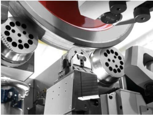
DANOBAT Integriertes Unterflur-Messsystem

Auf der kommenden Messe InnoTrans stellt das Unternehmen seine technologische Entwicklung für intelligentes Reprofilieren vor. Die von DANOBAT entwickelte Technologie reduziert die Zykluszeit, erhöht die Prozesssicherheit und verlängert die Lebensdauer der Räder. Am Stand werden auch die ganzheitlichen Lösungen von DANOBAT für alle Fertigungsprozesse von Schienenfahrzeugteilen vorgestellt. Darüber hinaus wird das Unternehmen die Möglichkeit nutzen, sein digitales Leistungsversprechen, bestehend aus eigenen, technologischen Entwicklungen auf Basis der Industrie 4.0, zu teilen. Ziel ist es, die Schaffung intelligenter Produktionsräume voranzutreiben, die mit vernetzten Anlagen ausgestattet und in der Lage sind, autonom zu arbeiten.