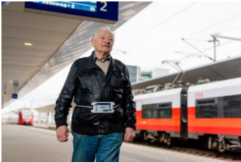
„Guide-Me“-Nutzer mit Freihand-Smartphone

„Guide-Me“ ist ein neuartiges Video-Assistenzsystem für alle Reisenden wie auch für Menschen mit Behinderung und Einsatzdienste. Der Fahrgast kann mittels Smartphone einfach per Knopfdruck Hilfe von einer Leitstelle oder einem Familienmitglied anfordern. Der Helfende verfügt dabei neben dem „Live“-Kamerabild auch über Audio - und Datenverbindung. Per Datenverbindung können der aktuelle Standort per GPS und auf Wunsch auch wichtige Informationen zur hilfesuchenden Person (Wohnadresse, Medikamente, Angehörige usw.) übermittelt werden. Der Reisebegleiter unterstützt alle Menschen, die sich in komplexen Gebäuden wie Einkaufszentren, U-Bahnen, Bahnhöfen oder Flughäfen unsicher fühlen, bei der Navigation und Orientierung. Mit diesem Assistenztool (für Smartphone und PC) kann punktgenau, in Echtzeit, flächendeckend und ohne dabei spezielle Infrastruktur nachzurüsten, Unterstützung angeboten werden.