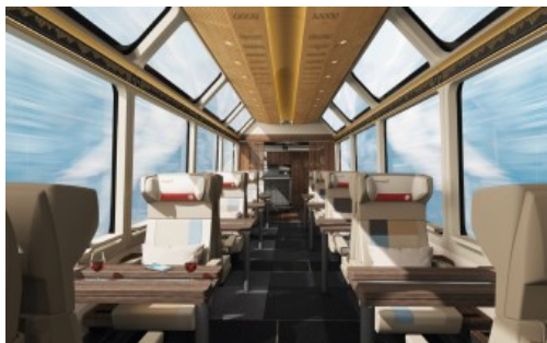
Die neuen Sitze

Das Konsortium der Rhätischen Bahn und der Matterhorn Gotthard Bahn hat BORCAD im Jahre 2017 als Lieferant von Schlüsselkomponenten für seine Luxusklasse des Glacier Express ausgewählt. Der Sitz ist dank seiner farbigen Polsterung (Design by NOSE), der Lage der Seitenkonsole mit Bedienelementen, 220 V-Steckdosen (nach schweizer und deutscher Norm) als auch USB-Ports außergewöhnlich. Der elektrisch verstellbare Sitz bietet den Fahrgästen den bestmöglichen Komfort während der Fahrt durch die wunderschöne schweizer Landschaft. Seine Ergonomie basiert auf dem unübertroffenen Konzept des COMFORT Sitzes, für das BORCAD den Red Dot Design Award verliehen bekam. Der neue Sitz wird auf dem Stand von BORCAD in Modellumgebung mit einem Originaltisch und weiteren Interieurelementen präsentiert.