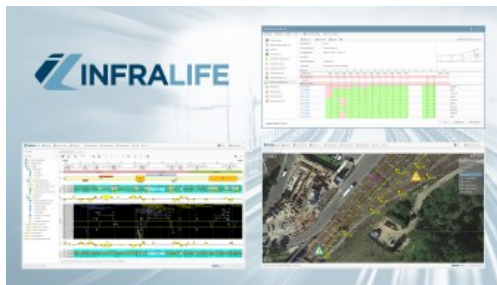
Streckenband, GIS-Karte, Weichenprüfblatt

Die Softwarelösung INFRALIFE® des österreichischen Anbieters fokussiert auf das Management von technischen Anlagen und den Netzzustand. Anwender sind Infrastrukturmanager, Anlagentechniker und all diejenigen, die Netz- und Anlageninformationen benötigen. Zu den Einsatzmöglichkeiten und Funktionen gehören Infrastruktur Master Data, Management, Zustandsüberwachung, periodische Instandhaltung sowie Mangel-, Störungs- und Life-Cycle-Management. Das Produkt ist mit Best Practice vorkonfiguriert und sofort einsetzbar. Die Plattform basiert auf der aktuellen Technologie, ist hochkonfigurierbar und bietet eine Mobile Applikation für das Servicepersonal. Ein Alleinstellungsmerkmal der Software ist die Visualisierung der Daten in Karten und Management Dashboards.