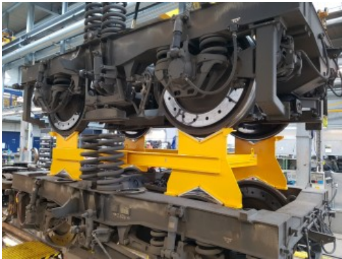
Auf Radstand einstellbare Stapelgestelle als ideale Lösung zur platzsparenden Drehgestelllagerung