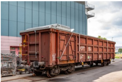
Die zukunftsweisende Verdecklösung für E-Wagen

Das neue Edscha TS Dichtungssystem für die Nach- und Erstausrüstung an allen gängigen gedeckten Wagen der Gattungen Shimmns und Rilns eliminiert das Problem von Undichtigkeiten und erspart den Transporteuren teure Folgekosten. Die von der European Trailer Systems entwickelten und als Weltpremiere gezeigten Profile aus Gummi sind selbst bei älteren Waggons, die dementsprechende Abnutzungen aufweisen, einfach nachzurüsten. Das patentierte Clipsystem kann überall und jederzeit auf jede Spriegelform montiert werden. Kein Nieten oder Kleben oder spezielles Werkzeug sind nötig – einfach aufdrücken und fertig. Als weitere Weltpremiere wird auf der InnoTrans ein Verdeck für offene Güterwagen der Regelbauart E – genannt Railway OpenBox – vorgestellt. Damit läutet Edscha TS das Ende der zeitaufwändigen und gefährlichen Abdeckungsarbeit mit losen Planen ein. Das von einer Person zu bedienende Verdeck wiegt auf zehn Meter Länge nur ca. 300 Kilogramm und garantiert somit eine höhere Zuladung.