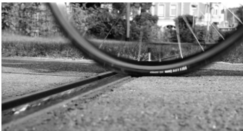
Velosicheres Gleis verhindert Unfälle

Straßenbahnschienen sind ein Problem für Radfahrer. Um die Sturzgefahr zu verringern, hat Dätwyler ein velosicheres Gleis entwickelt, bei dem das Verklemmen des Rades in der Schienenrinne unmöglich wird. Auch Fußgänger profitieren von diesem System, da ein Umknicken verhindert wird. Dies erreicht Dätwyler mit einem in die Schienenrinne geschraubten Sicherheitsprofil. Eine Spurführungsplatte schränkt die Sinusfahrt des Schienenrades ein, erhöht dadurch die Lebensdauer des Gummiprofiles. Die gesamte Konstruktion lässt sich jederzeit und ohne großen Arbeitsaufwand ausbauen, um z. B. Schienenarbeiten durchzuführen. Damit Schmutzpartikel die Rinne nicht verschließen, besitzt sie einen Entwässerungsablauf und lässt sich komplett ausspülen. Mit der neu entwickelten RAILRESTORE stellt Dätwyler eine weitere Neuheit vor. Damit lassen sich Schienenbrüche in kürzester Zeit auf höchstmöglichstem Niveau beseitigen.